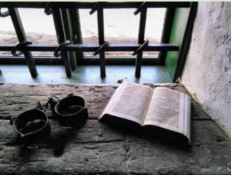
Dömd till döden.

16 okt kl. 19-20 Benny Rosenqvist, Seans & frågestund. Första anm.dag 26 aug. Pris 50kr för medlemmar och 150 kr för icke medlemmar. Anm till anianordgren47@gmail.com eller sms 0704-220263. Swish i första hand (efter bekräftelse) till 123-3400256. Betalning kan även ske i samband med föredraget med Swish eller kontant. Plats: Hörsalen i Höllvikens gamla biblioteksbyggnad. Arr: Bibliotekets vänner i Höllviken.