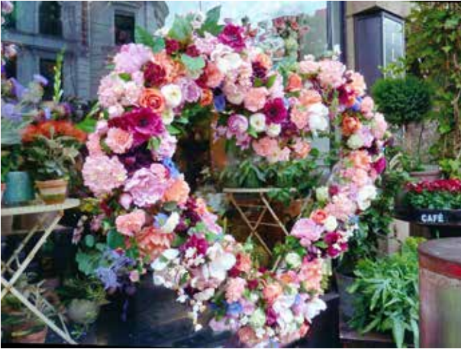
Vellinge bibliotek: K-Å Holmgren, B. Olsson, Vellinge fotoklubb, "Kärleken".