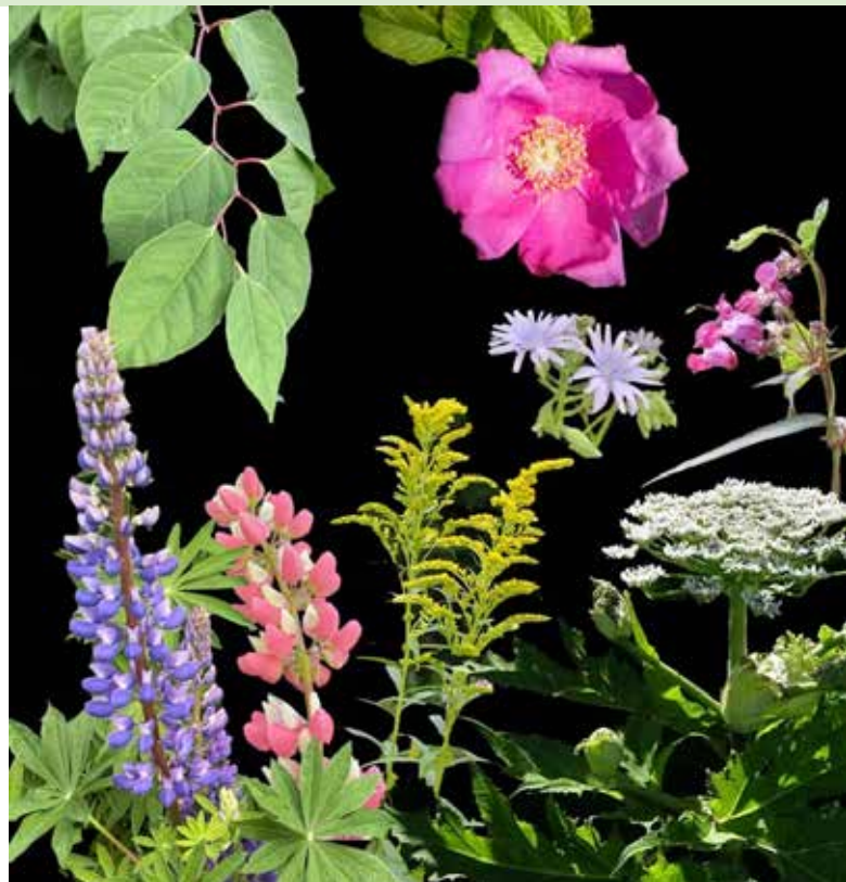
Invasiva växter i trädgården och naturen.

19 nov kl. 10.30-11.30 Boktipsfrukost. Tillsammans med bibliotekarier från Trelleborgs bibliotek bjuder vi på mängder av boktips och en god fika - varmt välkomna! Föranmälan till biblioteketsk@vellinge.se eller 040-425590. Plats: Skanörs bibliotek. Arr: Skanörs och Trelleborgs bibliotek.