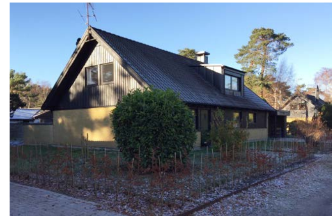
1970-talets dyrkan av underhållsfrihet och rationalitet visade sig i rena gula eller mörkt rödbruna tegelfasader. Snickerierna var laserade mörkt bruna.

Hus i grupp - möjlig kulörändring utan bygglov