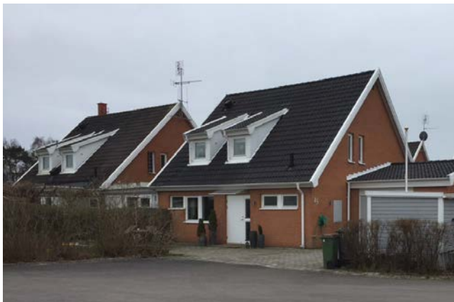
Under 1980-talet dominerar pastellfärger oftast på putsade eller slammade fasader eller ljusröd tegel med vita snickerier.