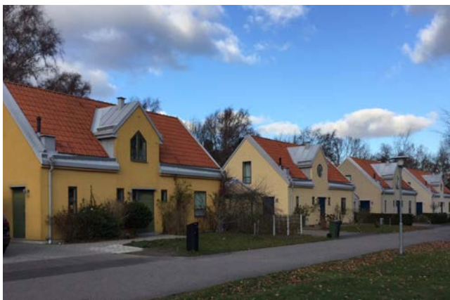
1990-talets bostadsområden har ofta en mer färgstark och varierad färgsättning.

Det krävs bygglov inom detaljplanelagt område om en ändring innebär att byggnaden byter färg, fasadbeklädnad eller taktäckningsmaterial eller om byggnadens yttre utseende avsevärt påverkas på annat sätt, enligt plan- och bygglagen 2010:900 (PBL), 9 kap 2 §, punkt 3 c. Vad innebär då egentligen uttrycket "avsevärt påverkas"? Det är ett faktum att det finns få juridiska överprövningar att utgå från och att det därför är av värde att myndighetsserviceämnden och myndighetsserviceavdelningen kan ge så entydiga svar som möjligt vid förfrågningar. Materialbyten kräver dock i allmänhet bygglov – ring bygglovsenheten och informera er!