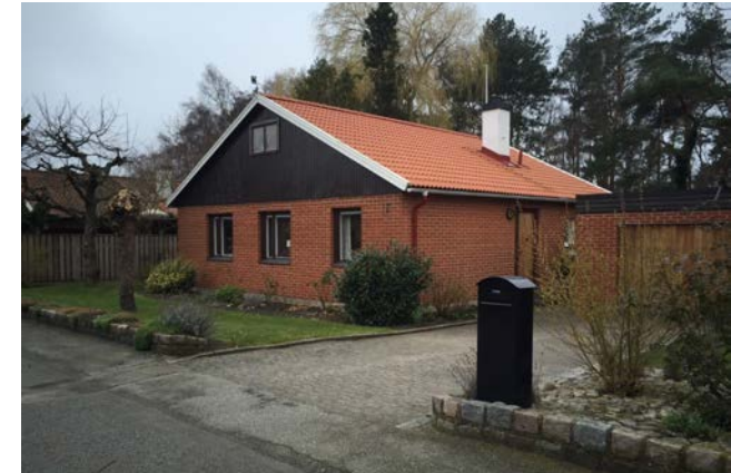
1960-talets småhus var ofta i rött tegel eller vitmålad lättbetong med bruna snickerier.

Varje decenniums karaktär och färgsättning framträder tydligt efter vår genomgång. 1960-talets småhus var ofta i rött tegel eller vitmålade tegelfasader med bruna snickerier, medan 1970-talets dyrkan av underhållsfrihet och rationalitet visade sig i rena gula eller mörkt rödbruna tegelfasader. Snickerierna var förstas laserade mörkt bruna. Under 1980-talet dominerade pastellfärger oftast på putsade eller slammade fasader eller ljusrött tegel med vita snickerier. 1990-talets bostadsområden har ofta en färgstarkt och varierad färgsättning. Dessa olika utgångspunkter ger olika förutsättningar. Färgsättningen från ett visst decennium hänger naturligtvis samman med hur man utformade byggnadsdelarna under samma tid. En byggnad ingår i en större helhet. Det blir därför lätt fel om t ex ett 70-talshus målas om i 80-talsfärger och vice versa.