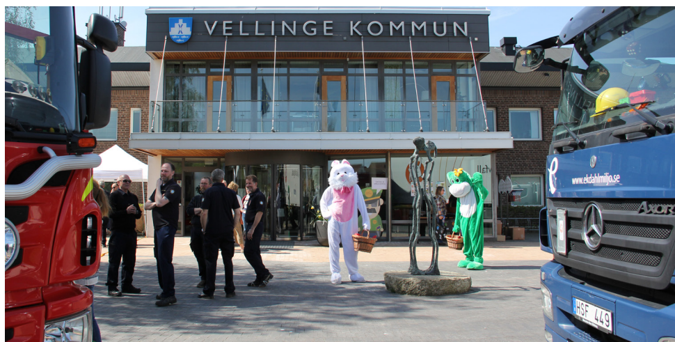
Öppet hus 2017