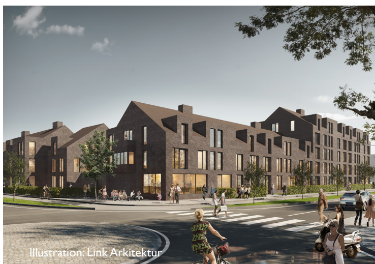
Illustration: Link Arkitektur