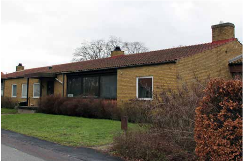
Det gamla kommunalhuset kommer att rivas för att ge plats till nya bostäder.

– Jag tycker det är väldigt spännande och roligt att gräva djupare i hur Västra Ingelstad kan utvecklas. Det är