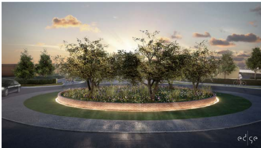
Illustrationsbild på rondellen.

Idag är Norra infarten bara en avfart från motorvägen som slutar i en korsning vid Norra leden, men inom ett år kommer besökare till Vellinge mötas av en vackert belyst cirkulationsplats som följs av en ny vägsträcka som letar sig rakt in till centrum.