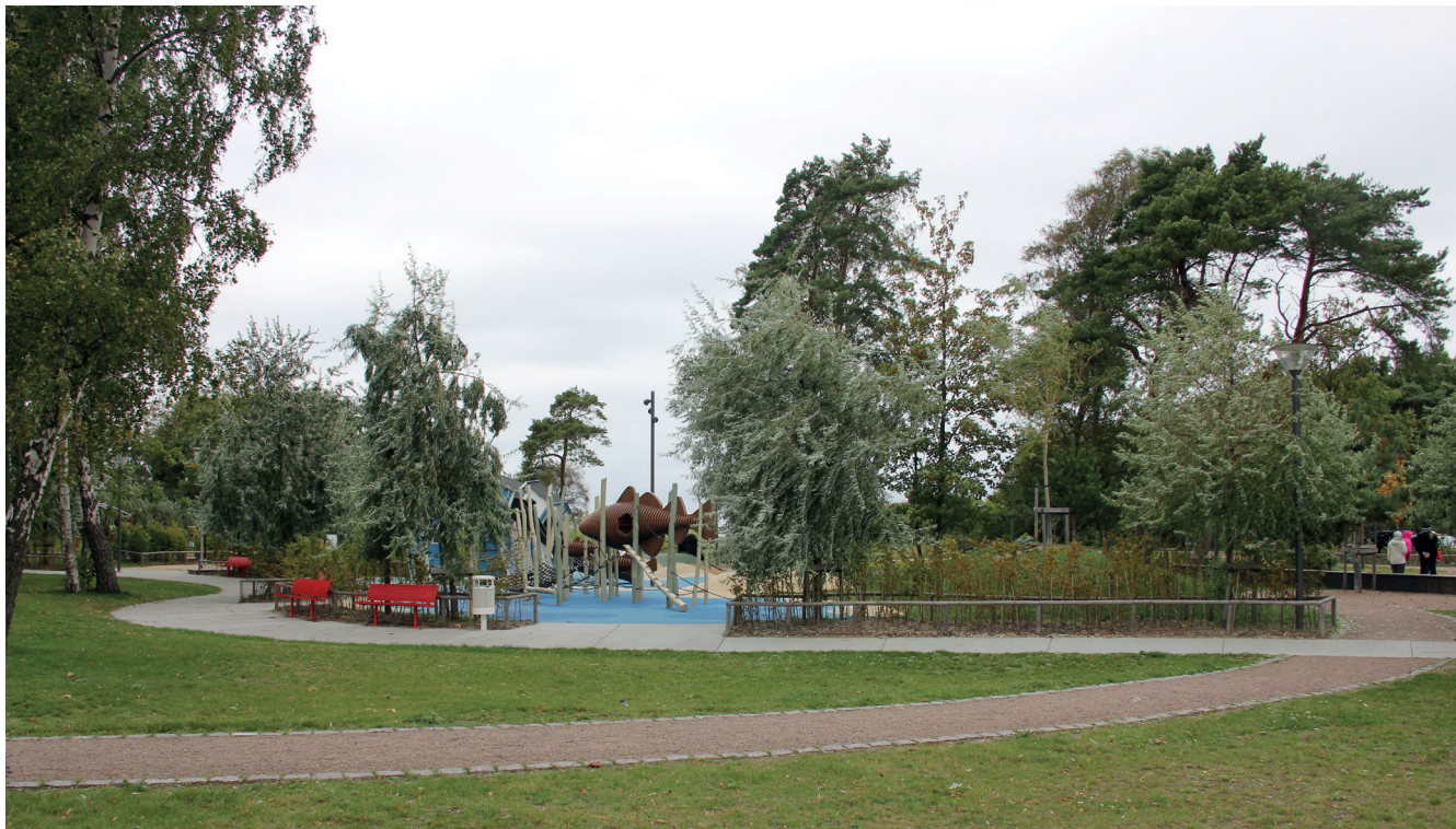
Den nya busstationen vid Nyckelhålsparcken ska inspireras av parkens lekfulla formspråk.

Arbetet med att planera och bygga kommunens nya busstationer utmed väg 100 och E6 pågår för fullt. Ambitionen är att skapa plats för framtidens kollektivtrafik med stationer inspirerade av områdets lokala karaktär.