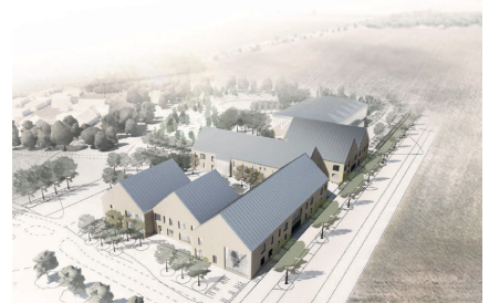
Skiss: Arkitektkontoret Tengbom

Ungefär såhär kommer skolan att se ut när projektet är färdigt.