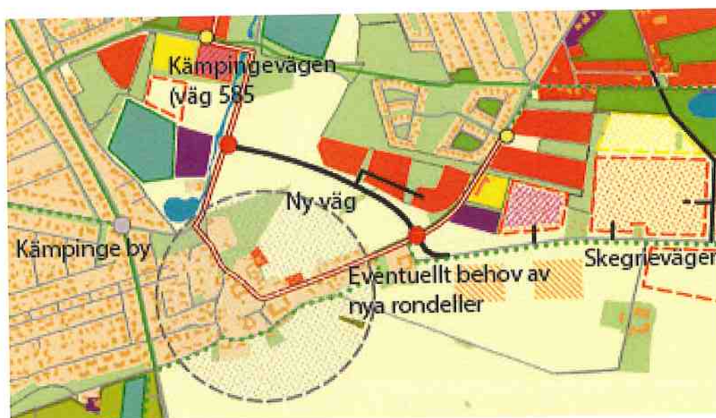
Utdrag ur gällande översiktsplan.

I gällande översiktsplan, ÖP 2010, laga kraft 2013-06-27, aktualiserad 2017-12-06, KF § 172 föreslås aktuell sträcka som en förlängning av Skegrievägen (väg 517). Syftet är att avlasta trafiktrycket genom Kämpinge by och ge bättre utbyggnadsmöjligheter för Rängs sand. Kämpinge by är en bevarandevärd kulturmiljö och byn ska bevaras. ÖP 2010 anger även att jordbrukslandskapets siktstråk mellan byarna är viktigt och att de därför inte får byggas samman. Ett siktstråk mellan Rängs sand och Östra Höllviken är utpekad i översiktsplanen. Detaljplanen är förenlig med översiktsplanen.