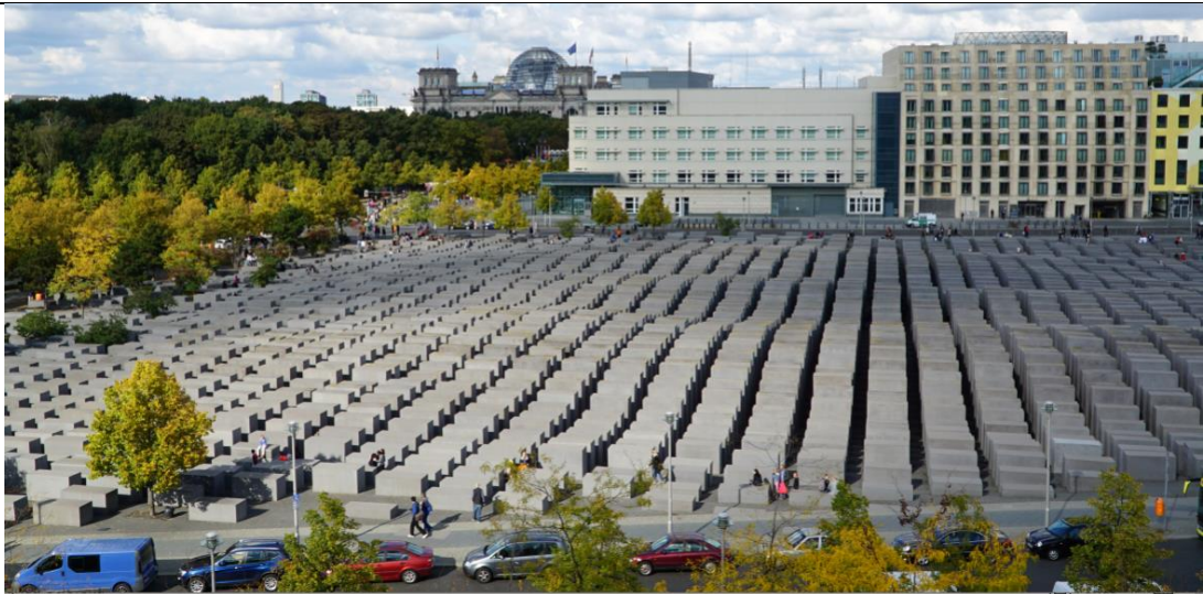
Förintelsemonumentet i Berlin (Holocaustmemorial)